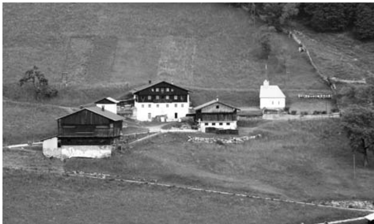
Stammhof der Familie Lexer in Unterfrohn bei St. Lorenzen im Lesachtal