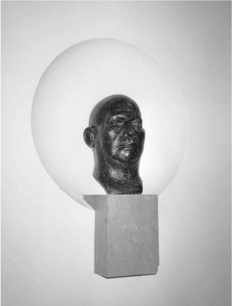
Abb. 1 Lexner-Büste in der Universitätsklinik München, Nußbaumstraße