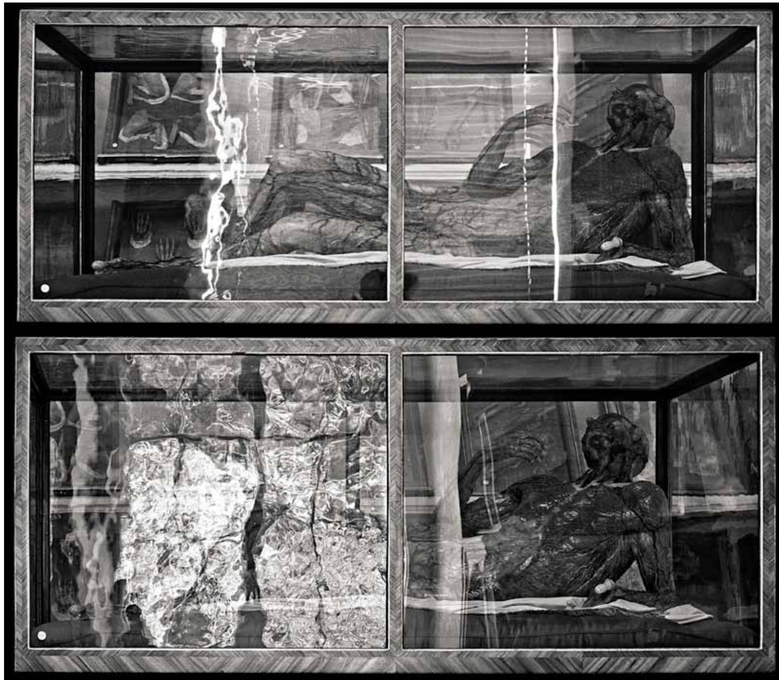
Josephinum Wien III (zwei mal Vitrine Nr. 134)