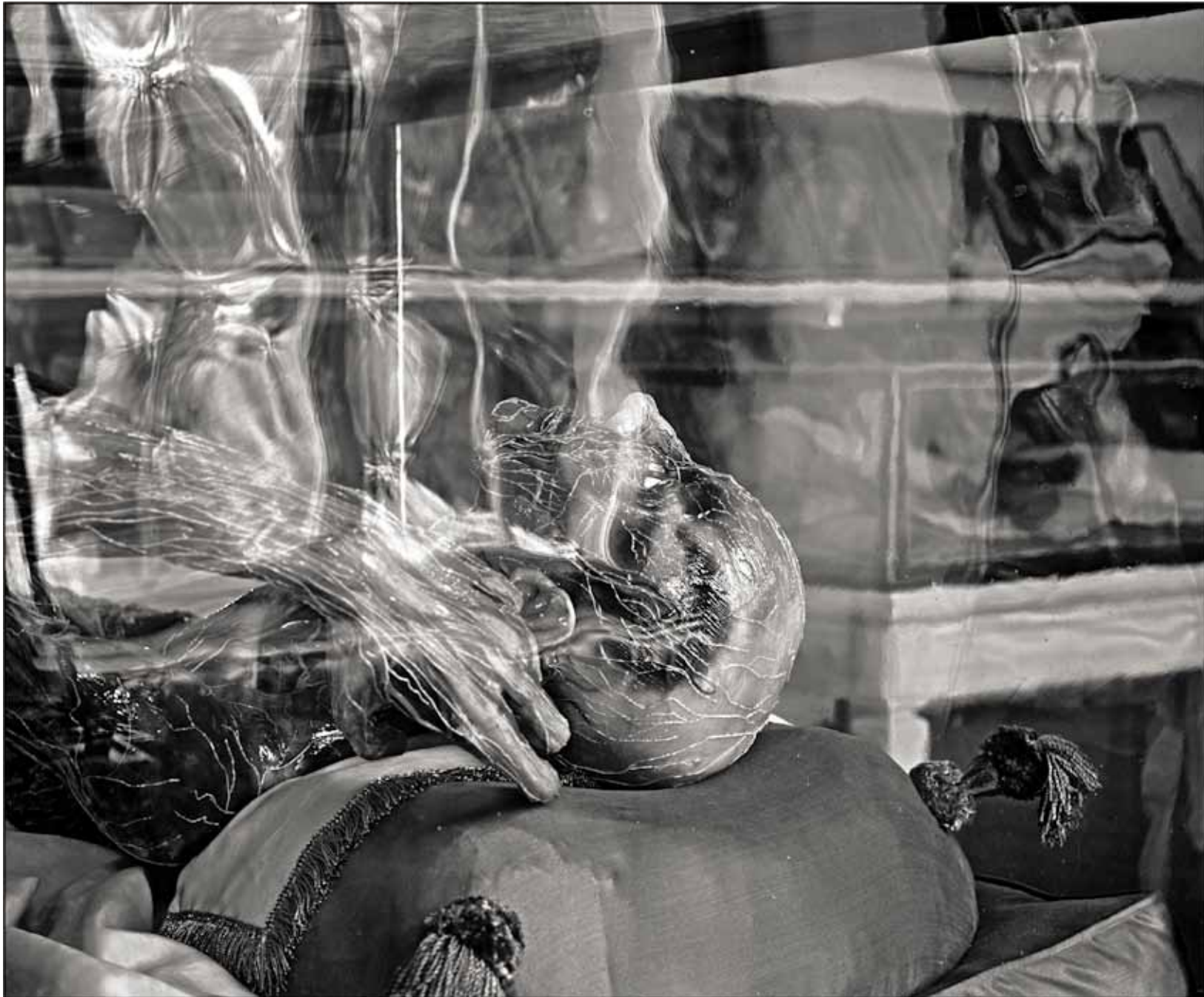
Josephinum Wien X (Venenmann)